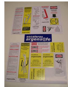
ETIQUETAS DE SEGURIDAD