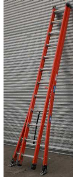
REBATIDA PARA TRASLADO