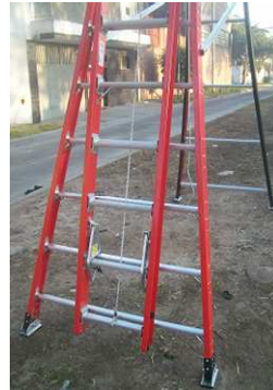
- BASE CONVERGENTE PARA ESTABILIDAD ZAPATAS ANTIDESLIZ.