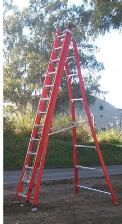
CONTRA FRENTE O BASTIDOR CON O SIN PELDAÑOS