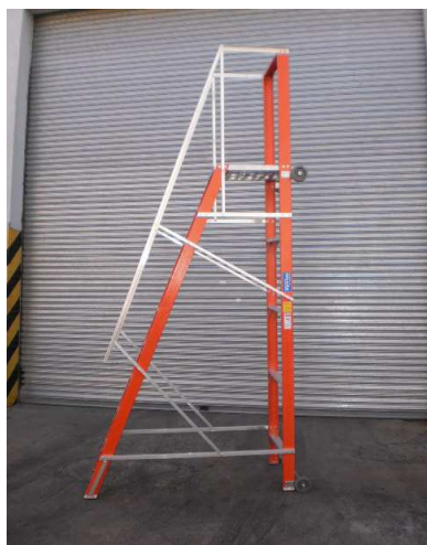
UNIDAD PARA TRASLADO HORIZONTAL