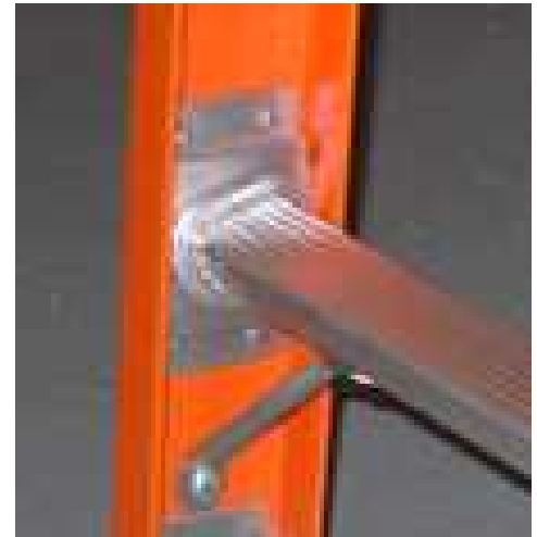
Escuadras de Refuerzo Anti-Torsión