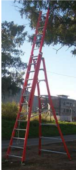
BRAZOS LATERALES ANTI-CIERRE DE ALUMINIO