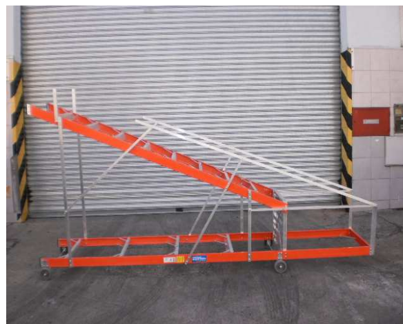
UNIDAD EN POSICION PARA TRASLADO HORIZONTAL