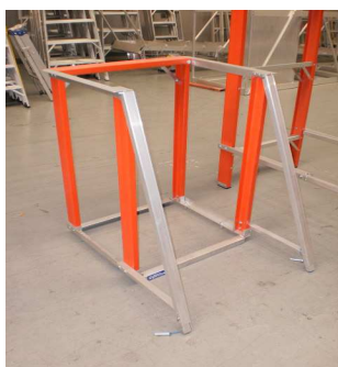
PLATAFORMA DE FACIL MONTAJE