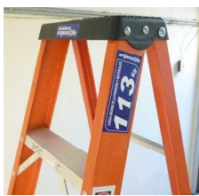
ESCALON 65 MM

TAMBIEN DISPONIBLE SERIES 63 - 64 MODELOS SIMPLE Y DOBLE TIPO 1 – 113 KG. CAP.DE CARGA