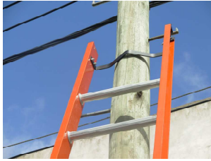
APOYA POSTE CON CINTURON AMARRE

Serie ED – 2 – 42 - Cap.de carga 136 Kg.-