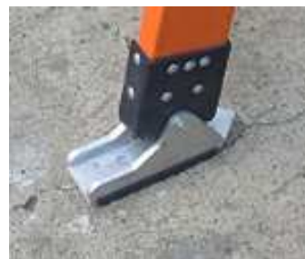
Zapatas antideslizantes Porta zapata Alto impacto