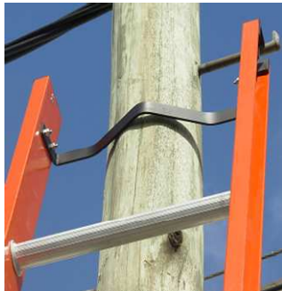
Apoya poste con Cinturon de amarre opcional