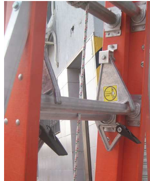
DOBLE TRABA PELDAÑOS SISTEMA GRAVEDAD Y SOGA DE EXTENSION