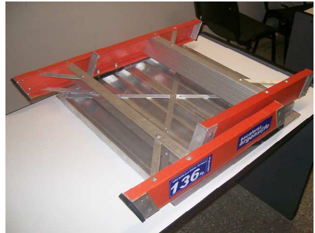
ESTRUCTURA REBATIBLE PRACTICA – LIVIANA