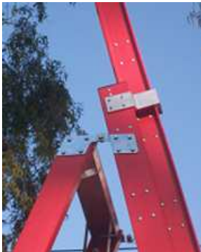
GUIAS Y BISAGRAS DE ALUMINIO – ACERO REFORZADAS