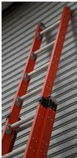
GUIAS Y BISAGRAS DE ALUMINIO – ACERO REFORZADAS