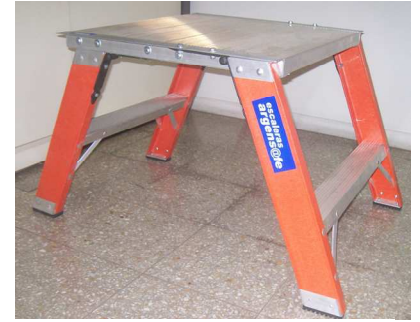
PATAS DE APOYO DE PRFV TRAVESAÑOS Y ESCUADRAS DE REFUERZO