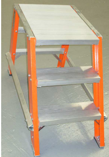
PARANTES DE PRFV SIMPLE O DOBLE

TABURETE DE 1 Y 2 ESCALONES de 140 / 280 mm