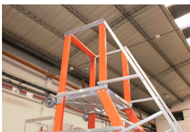
RUEDAS EN BASE DE PLATAFORMA