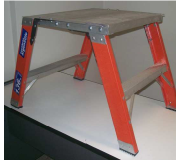
PLATAFORMA SUPERIOR DE 560 X 560 MM