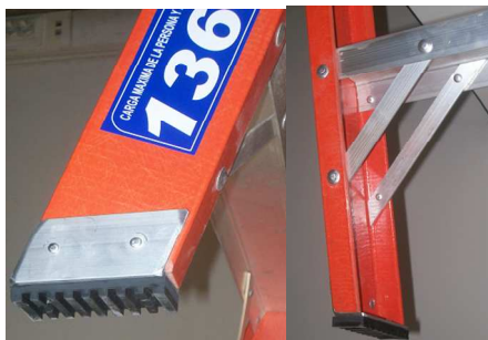
ESCUADRAS DE REFUERZO ANTI-TORSION

PLATAFORMA DIELECTRICA CON PATAS REBATIBLES